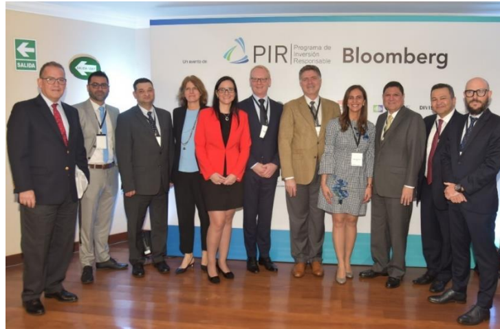
Expositores nacionales e internacionales y representantes del PIR