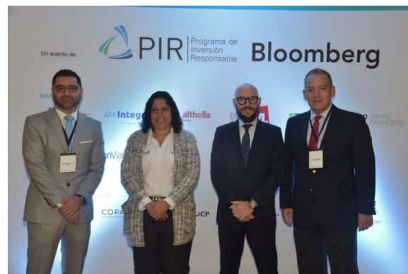
Fabiola Muñoz, Ministra del Ambiente y representantes del Consejo Directivo del PIR.