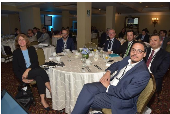
Asistentes al evento del PIR