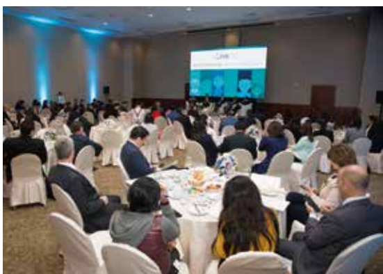
Asistentes al evento del PIR