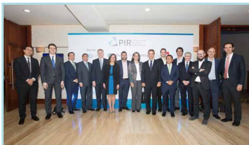
Expositores nacionales e internacionales y socios del PIR

El 13 de noviembre del 2019, se llevó a cabo con éxito el evento internacional del PIR, titulado “El Factor Social en las Inversiones”, gracias al apoyo de la Corporación Financiera Internacional (IFC) y la Cooperación Económica y de Desarrollo (SECO) de Suiza. Contó con la participación de destacadas autoridades y expertos nacionales e internacionales, quienes compartieron un espacio de discusión sobre los retos y oportunidades de las inversiones y su vinculación con los Objetivos de Desarrollo Sostenible (ODS). Asimismo, se presentó un espectro diverso de inversiones, partiendo por la inversión responsable hasta la inversión de impacto con el objetivo de considerar una generación de valor para los inversionistas y simultáneamente contribuir a la solución de los principales problemas sociales en nuestro país.