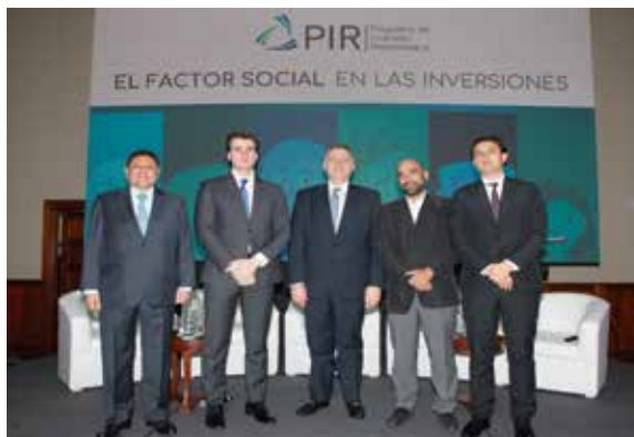
Panel 2: Agenda de Inversión Responsable: Próximos pasos en el Perú y LATAM