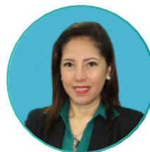
Shirley Pando Directora General de Inversiones ONP